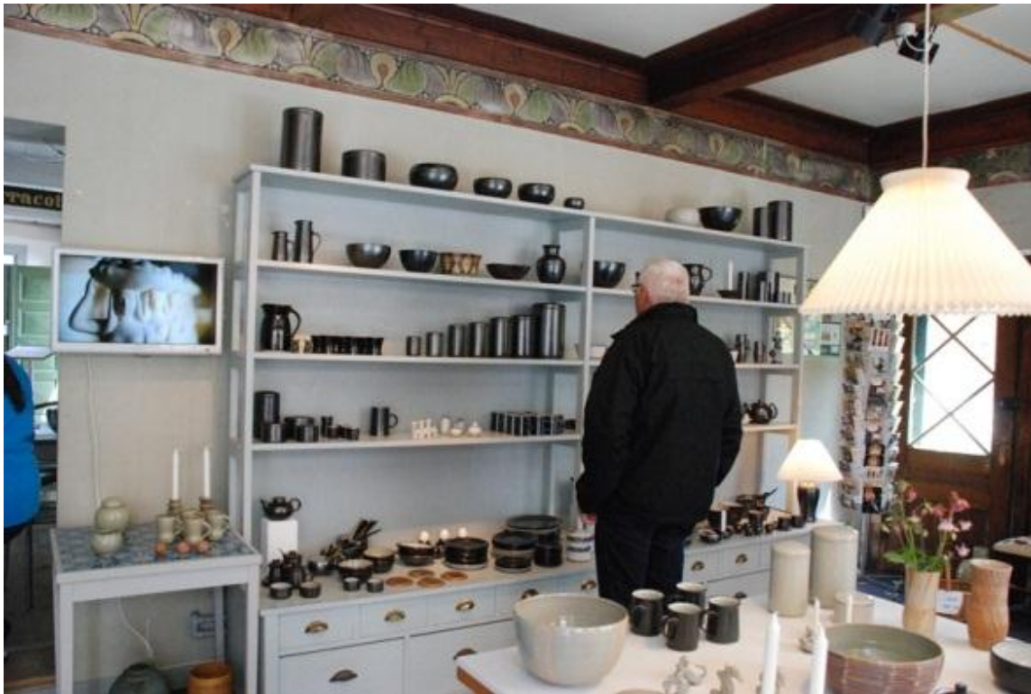
Fra butikkutsalget ved Hjorts Fabrik.